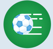
Schläge, Stöße oder Abrieb