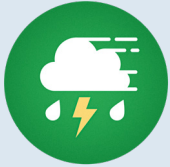
Schlagregen, Hagel oder Sturm