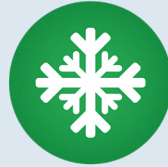
Schnee oder Frost