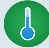
starke Temperatur- schwankungen