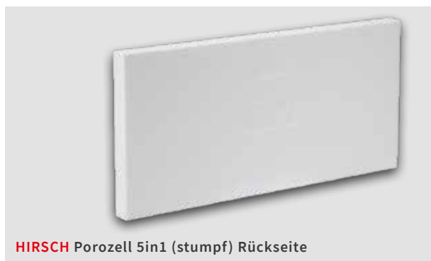
HIRSCH Porozell 5in1 (stumpf) Rückseite