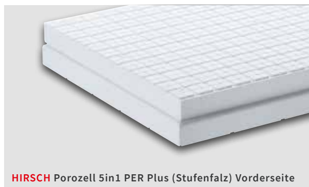
HIRSCH Porozell 5in1 PER Plus (Stufenfalz) Vorderseite