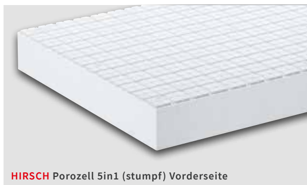
HIRSCH Porozell 5in1 (stumpf) Vorderseite