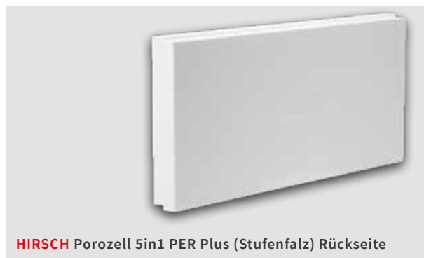
HIRSCH Porozell 5in1 PER Plus (Stufenfalz) Rückseite